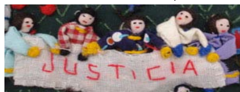
Detall d'una arpillera xilena

Un dels objectius principals de l'exposició va ser mostrar i explorar la violència política viscuda i soferta per les dones en diferents llocs del món. Com és sabut, els conflictes armats contemporanis tenen un gran impacte en la vida de les dones, però també és conegut que davant aquests contextos, les dones són també qui tenen un paper actiu, impulsant iniciatives de mediació i de construcció de pau (encara que cal considerar que les dones també participen